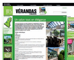
Véranda de rêve