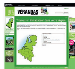
Module de recherche