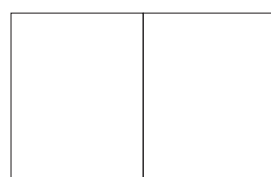
2/1 pages 2/1 pages 460 x 297 mm avec bords perdus 466 x 303 mm

Contact et/ou informations : publi@epninternational.com Livré digitalement via FTP : pour accéder à notre serveur ftp, envoyez un e-mail à ftp@epninternational.com Livré digitalement par e-mail : publi@epninternational.com Livré par la poste : Maison d'édition EPN International S.A., Pulsebaan 50/1, B-2242 Pulderbos