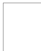
1/1 page 1/1 page 230 x 297 mm avec bords perdus 236 x 303 mm